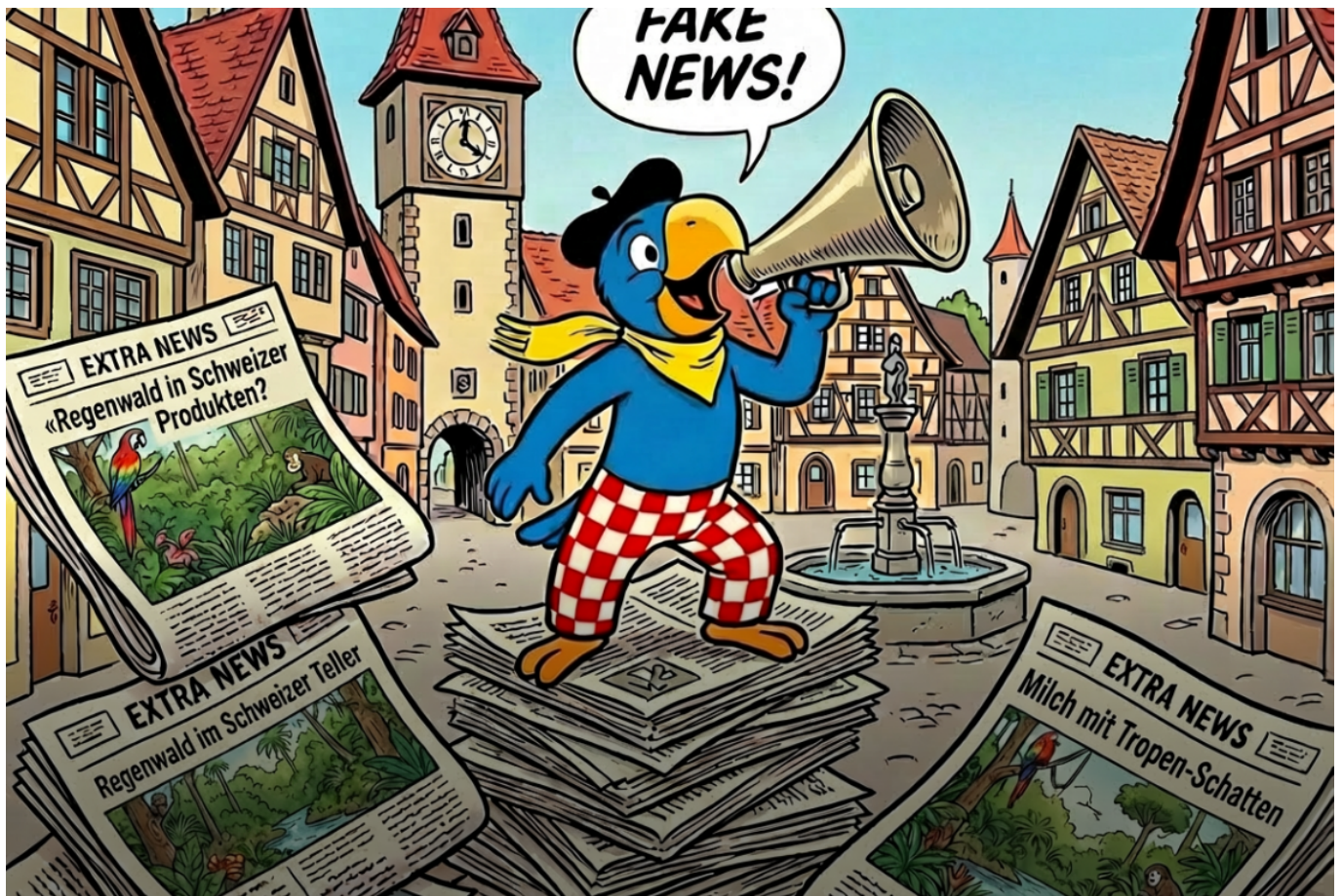
Globi und Fake News

Mit meinem Artikel habe ich einen Stein ins Rollen gebracht - und zwar einen ziemlich grossen.